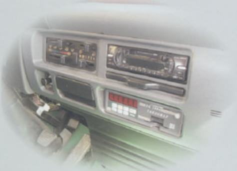
ISUZU NQR Uygulama