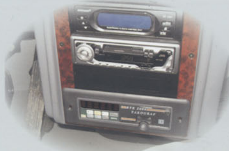
ISUZU ROYBUS Uygulama