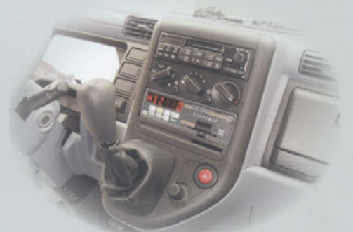
MITSUBISHI - CANTER Uygulama